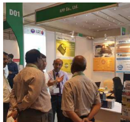
2016 년 G Fair 뭄바이