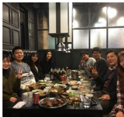
2016 년 아주대 멘토멘티